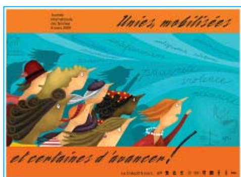
Huguette Latulippe / Promotion inc., Illustr. : Marie-Eve Tremblay, colagene.com