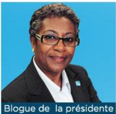
Blogue de la présidente