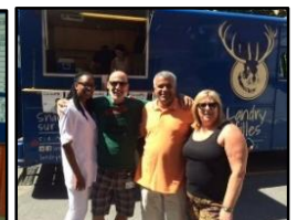
Montréal (AIM-FIQ) - Activités estivales