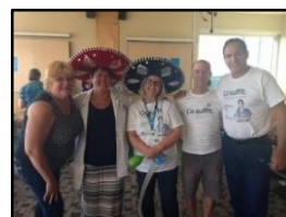
Hôpital Fleury (SIAM-FIQ) - Fiesta mexicaine