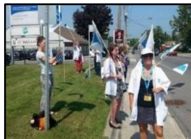
Lac des Deux-Montagnes - Manifestations contre la surcharge de travail et pour des meilleures conditions de travail