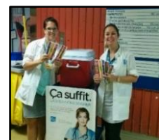
Saint-Jérôme - Distribution de popsicles