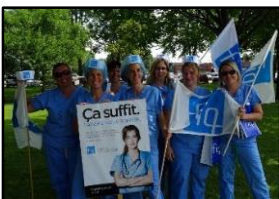
Montérégie - Port de coiffes et manifestations contre les compressions budgétaires

Plusieurs activités des syndicats de la FIQ se sont tenues au cours du dernier mois afin d'échanger avec les membres, entre autres, sur les enjeux et l'évolution de la négociation.